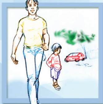
Đậu xe xa xa một chút rồi đi bộ tới văn phòng làm việc.