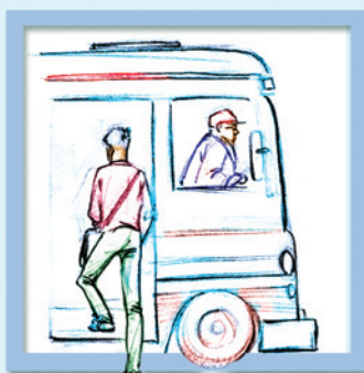
Đi xe buýt