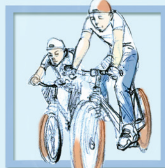
Lái xe đạp