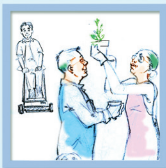
Ra làm vườn đều đặn