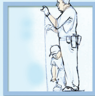
Sửa sang nhà cửa