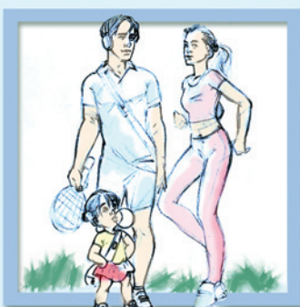
Chơi thể thao như quần vợt