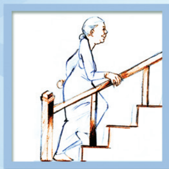
Đi cầu thang thay vì đi thang máy.